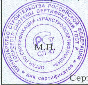
Схема сертификации З.